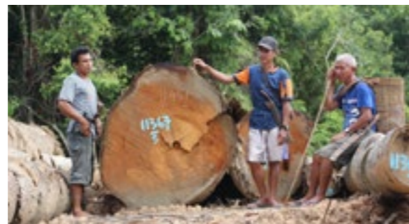
L'abattage de géants de la forêt vierge est un crime

www.regenwald.org/regenwaldreport/2019/514