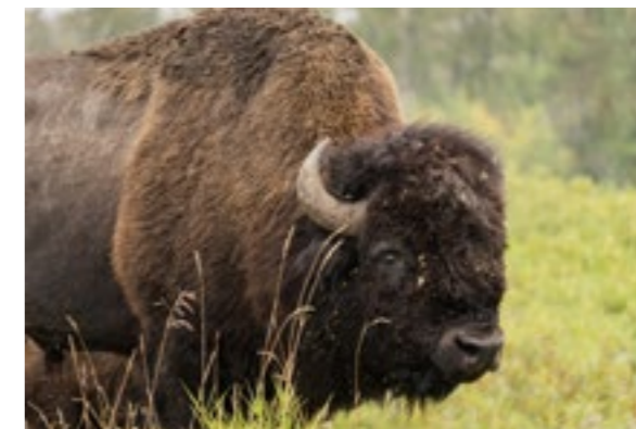
Une mine de sable bitumeux menace l'habitat de buffles