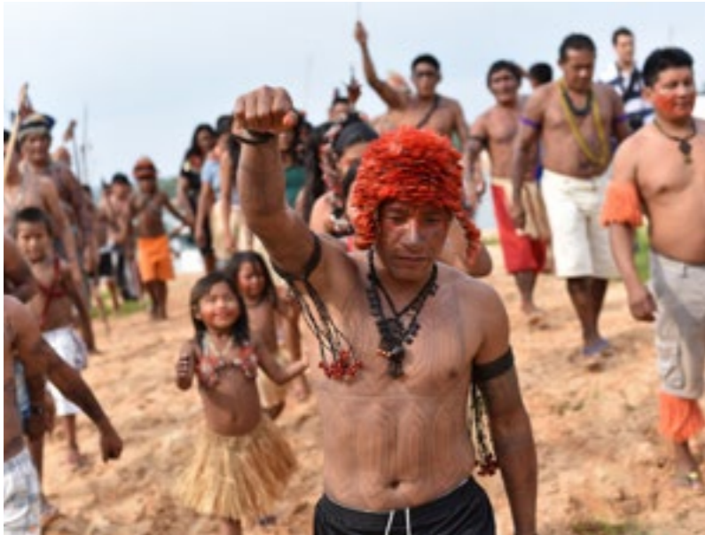
Les Mundurukú du Brésil semblaient avoir gagné contre les projets de barrages – ce succès a été réduit à néant par le nouveau président Jair Bolsonaro