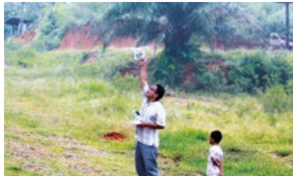
SOB documente la destruction de la nature à l'aide de drones

Depuis début mars 2018, la menace plane sur les forêts du lac Sembuluh : la société de plantation PT Salonok Ladang Mas a commencé à défricher une route à travers la forêt. Les habitants ont stoppé les bulldozers. Depuis, notre partenaire « Save Our Borneo » est sur place. Une partie de la forêt a été détruite mais l'organisation est parvenue à éviter tout dégât supplémentaire.