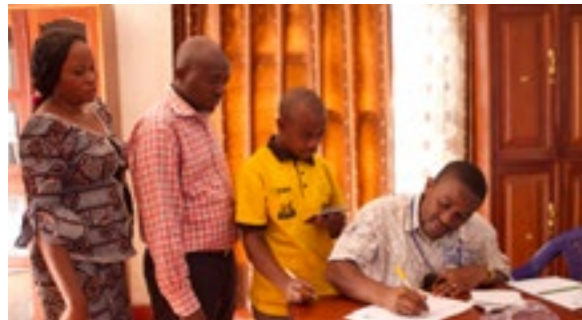
Signatures contre l'extraction de pétrole

Plusieurs de nos plus proches parents vivent au parc national de Virunga : les gorilles de montagne. Pour assurer leur survie, cette réserve doit être préservée. Les militants écologistes du Réseau CREF s'opposent aux plans d'extraction pétrolière du gouvernement dans les forêts. 19 organisations de la province du Nord-Kivu mobilisent la population pour faire pression sur le gouvernement à Kinshasa.