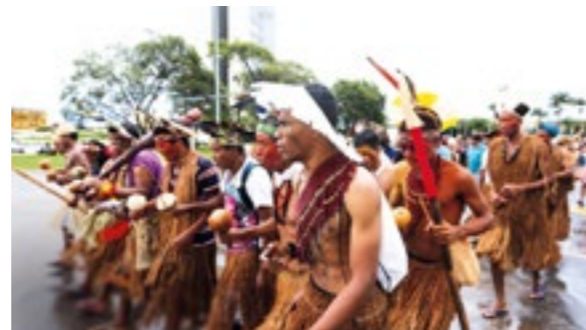
Les autochtones sont souvent les écologistes les plus engagés

www.regenwald.org/regenwaldreport/2019/512