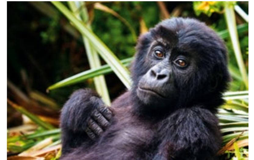
Les grands singes disparaissent