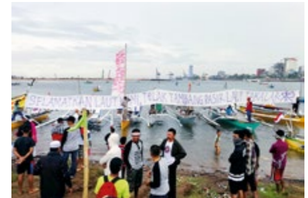
Manifestation contre l'extraction