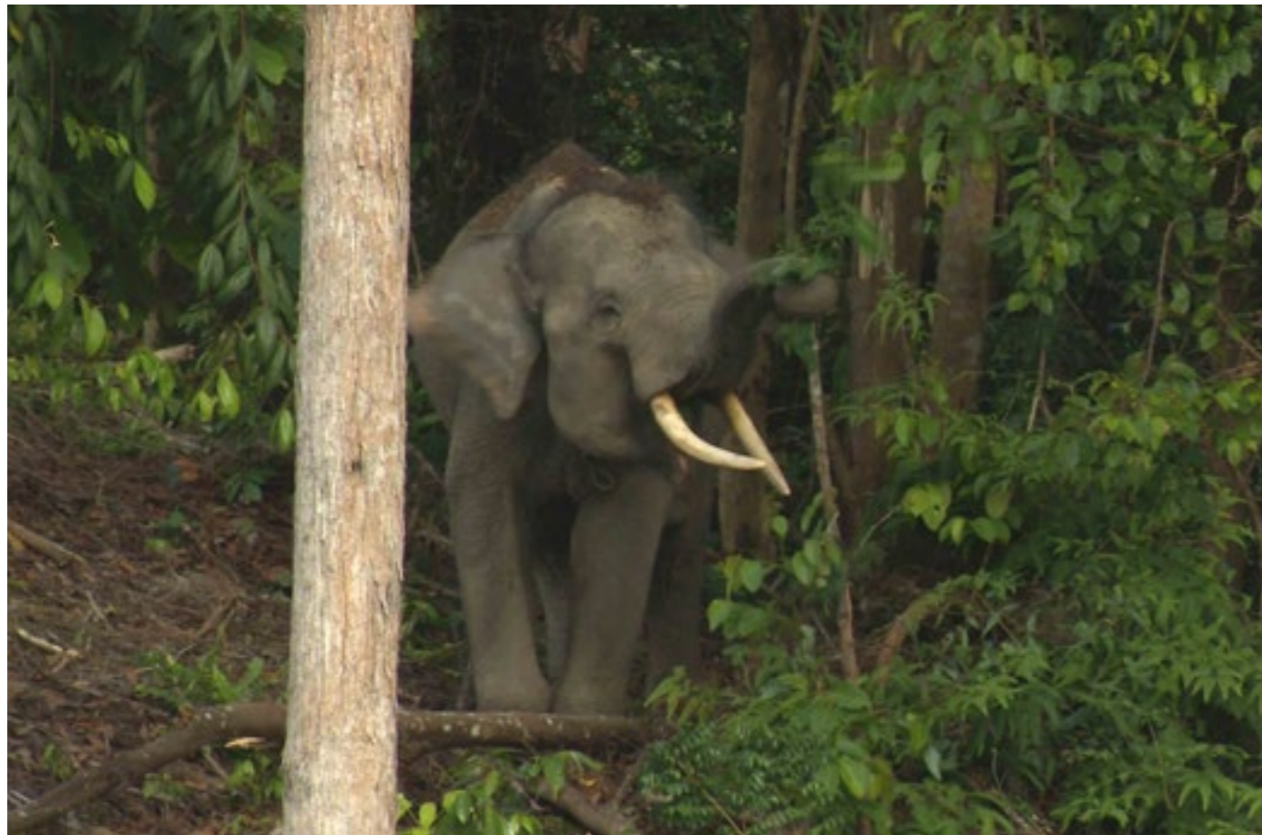
Pour survivre, les éléphants de Sumatra ont besoin de forêts protégées. À Sepintun, 2000 hectares de terres ont pu être préservées du déboisement.

Les réussites ne sont pas toujours linéaires. Certaines pétitions n'aboutissent ou contribuent à inscrire certaines questions à l'ordre du jour politique qu'au terme de plusieurs années de campagne. www.sauvonslaforet.org/succes