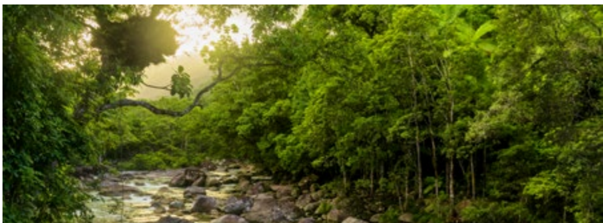
La forêt tropicale de Daintree se situe au nord-est de l'Australie

La jungle de Daintree en Australie existe depuis 135 millions d'années. Il n'est donc pas étonnant que les forêts tropicales aient été inscrites au patrimoine mondial de l'UNESCO et soient protégées, bien que de manière incomplète. Des militants écologistes de l'organisation locale Rainforest Rescue achètent donc des parcelles environnantes pour étendre la protection