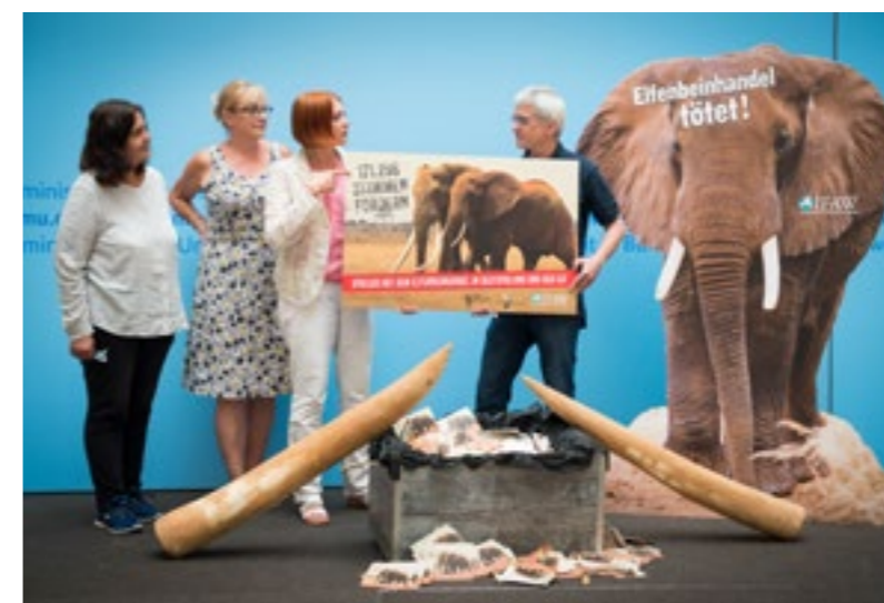
Notre message au ministère allemand de l'environnement : « Le commerce d'ivoire tue »